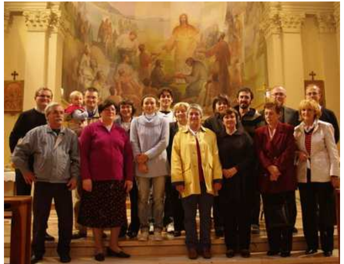
Il gruppo dell'ADMA di Nave