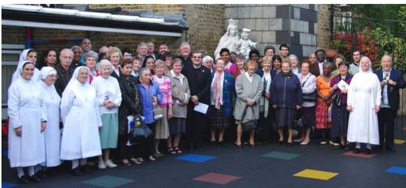
Il gruppo ADMA locale di Londra