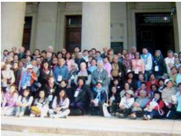
Partecipanti al congresso