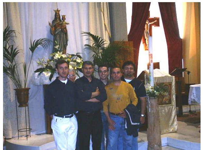
Consiglio ADMA di Alcamo

La hoja puede leerse en el siguiente sitio :