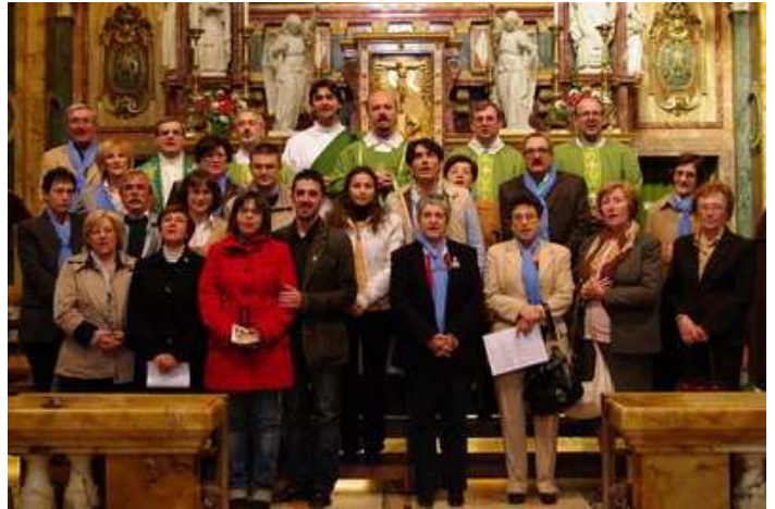
Nuovi membri dell'ADMA