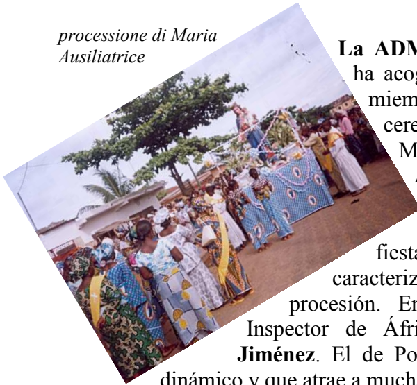
processione di Maria Ausiliatrice