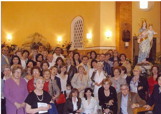
Il numeroso gruppo dei 50 nuovi soci dell'ADMA di Catania

quien en la homilía reclamó la misión de la Asociación y el compromiso de difundir la devoción a la Auxiliadora, viviendo los compromisos asumidos. Las actividades del grupo son: dos encuentros mensuales, el primer viernes del mes y el día 24: la promoción de la devoción a la Eucaristía y a la Auxiliadora