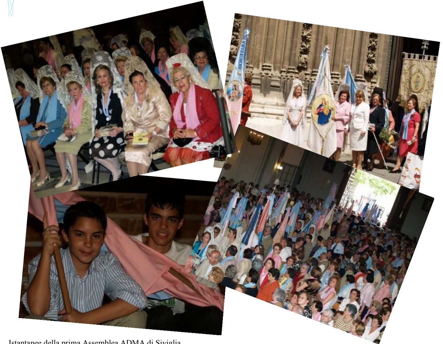
Istantanee della prima Assemblée ADMA di Siviglia