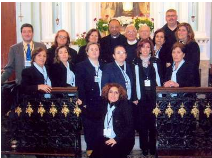
Gruppo ADMA di Istanbul

Después de la celebración todos fueron invitados al cocktail y participaron en una cena turca. Todo concluyó magníficamente bien. Éste es el primer grupo ADMA en toda Turquía y la Capilla es la única dedicada a nuestra Señora de Lourdes. Todos siguen tomando parte en el encuentro semanal. Las conferencias continuarán hasta septiembre. De aquí la gloria de María se difundirá en toda la Turquía.