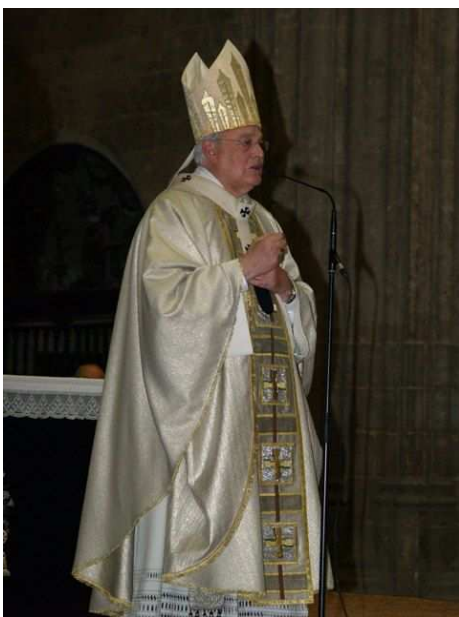
Il cardinale di Siviglia mons Carlos Amigo Vallejo

A las 11.00 se celebró la eucaristía en la prestigiosa e histórica catedral de Sevilla. Presidió la celebración el Cardenal Arzobispo, Mons. Carlos Amigo Vallejo. En su homilía el Cardenal, parafraseando la segunda lectura de la liturgia