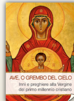
Ave, o grembo del cielo di Aa.vv. San Paolo, 2015 pagine 128, euro 8,90