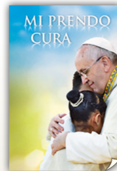
Mi prendo o cura Papa Francesco San Paolo, 2015 pagine 16, euro 1,80