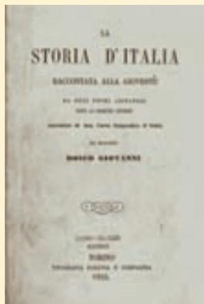
▲ La copertina de "La storia d'Italia raccontata alla gioventù" scritta da Don Bosco e pubblicata nel 1935.

Anzitutto il volume Salesiani di Don Bosco in Italia. 150 anni di educazione in Italia (Roma, LAS 2011), a cura di F. MORTO, ricco di 10 saggi di indole storica che coprono il primo centenario e di sei contributi di indole testimoniale relativi all'ultimo mezzo secolo. Passa così davanti ai nostri occhi, la Storia d'Italia di Don Bosco , l'azione preventivo-sociale dei SDB a fine '800 e primo '900, la collateralità dei SDB al Movimento cattolico, la loro passione educativa sul fronte di guerra e durante il fascismo, il decollo della SEI