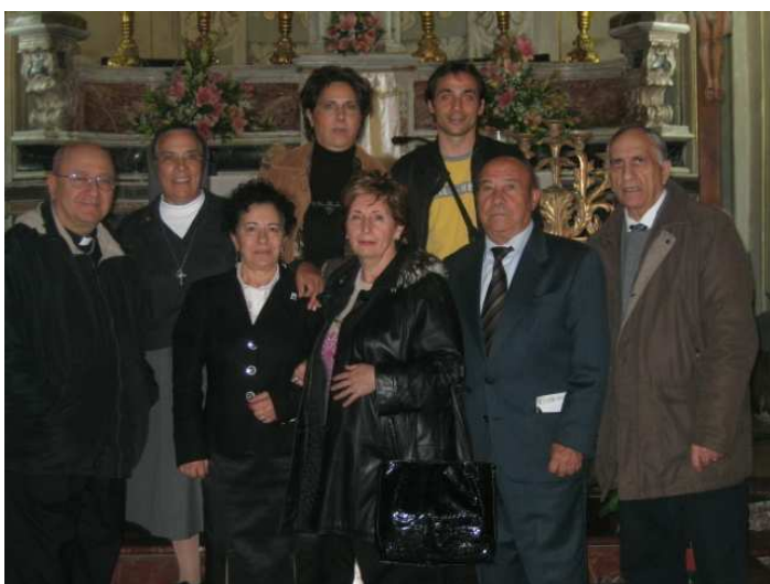
Consiglio Regionale ADMA della Sicilia