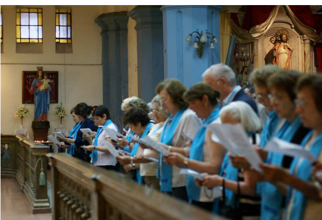
Gruppo ADMA di Cordoba (Argentina) il griono 24.11.2008 in occasione del rinnovo della promessa e della consegna della medaglia

Réunion annuelle des Présidents des groupes locaux dans l'Oeuvre salésienne de San Juan. Pour divers motifs certains n'ont pas participé, toutefois la rencontre a permis de clarifier la présence de l'ADMA, surtout son importance