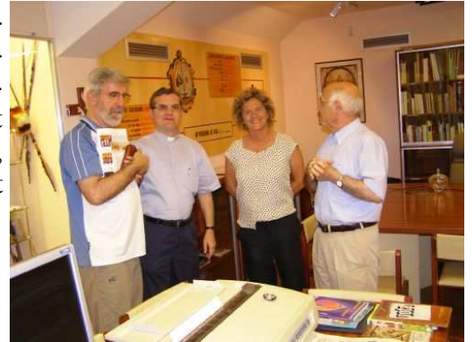
A fianco: Bilbao Visita alla sala di salesianità